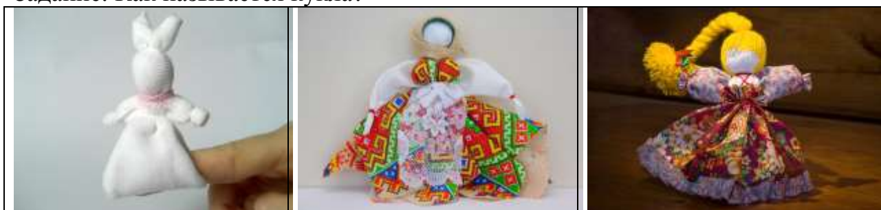
Зайчик на пальчик